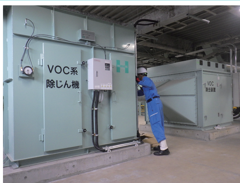
VOC系除じん機と除去装置(奥側)