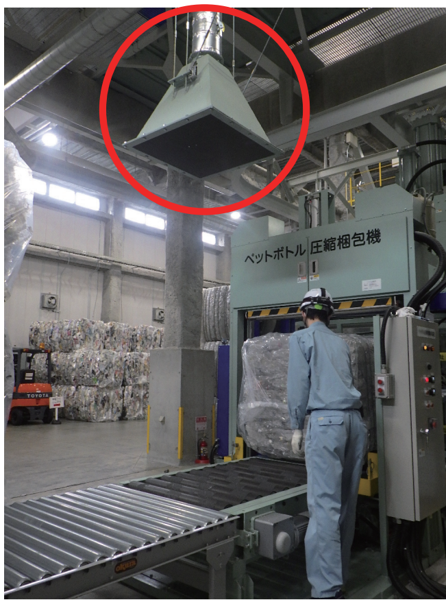
建物内の空気を吸引するダクト(写真上部)

このため、施設は、搬入物を建物内に収容し、作業はすべて建物内で行い、出入口扉やエアーカーテンにより施設の気密性を高め、悪臭の漏洩を防止する構造となっています。また、建物内の空気は吸引し、粉じんや悪臭、揮発性有機化合物(VOC)を取り除き、清浄な状態として屋上から排気しています。